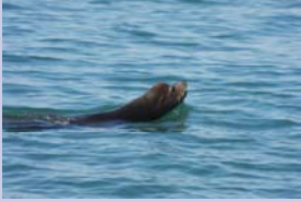
Un lobo marino sigue el Corsair.