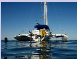
El Corsair 24, una trimaran sailboat